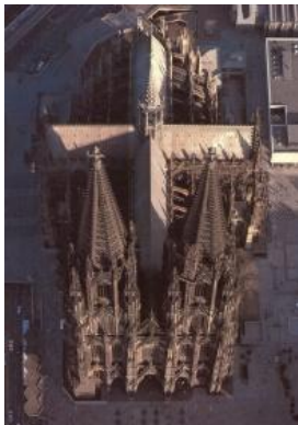
Ключи: Kölner Dom