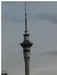
Ключи: Oakland Sky Tower