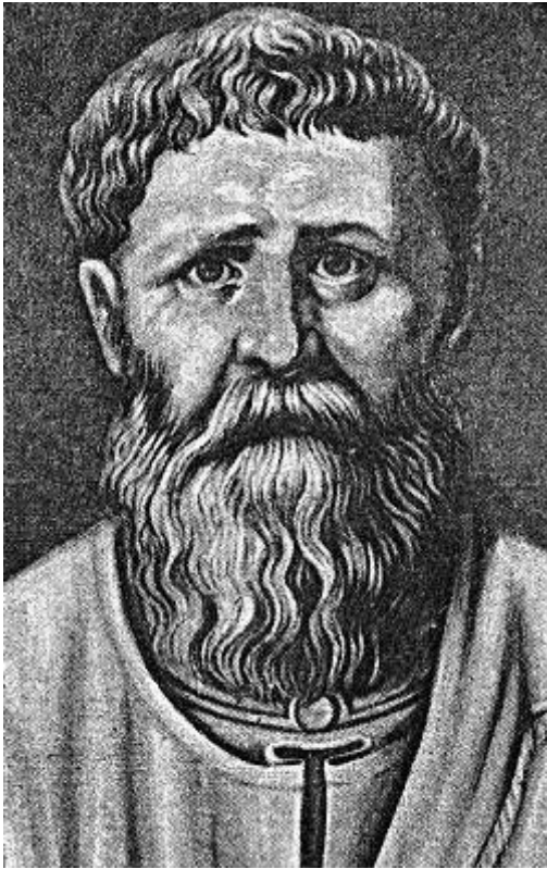
«О Граде Божьем»